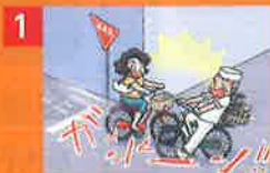
1 突然の自転車事故!

男子小学生が女性と衝突。女性が意識不明となり、事故を起こした小学生の母親に9,521万円の賠償を命令 (神戸地方裁判所 平成25年7月4日判決)