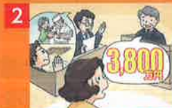
2 事故が原因で重度の後遺障害を被ったために、高額の賠償金が裁判で決定!