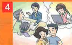
4 相手との賠償交渉も保険会社のスタッフに任せ安心、解決へ!