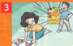
3 自転車事故に備えた賠償保険に入っていたので!