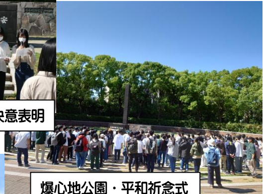
爆心地公園・平和祈念式