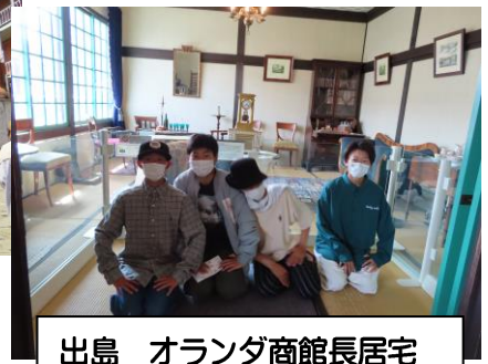
出島 オランダ商館長居宅