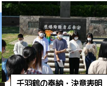
千羽鶴の奉納・決意表明