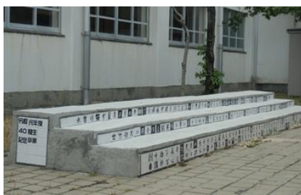
卒業生の卒業制作