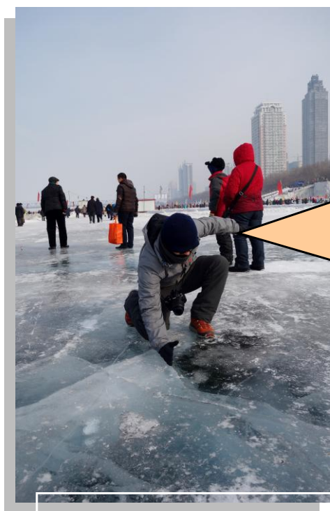
厳冬ハルビンの河の上にて